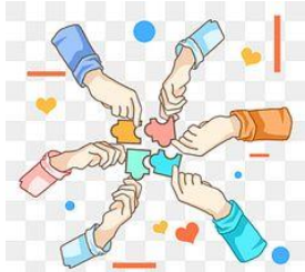
RECOMENDACIONES COMITÉ CONTROL SOCIAL