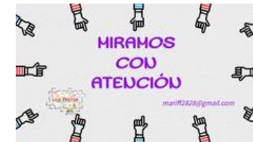
ATENCIÓN QUEJAS Y PETICIONES