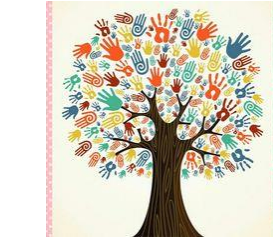
BALANCE SOCIAL Y PORTAFOLIO DE SERVICIOS