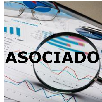
REUNIONES COMITÉ CONTROL SOCIAL