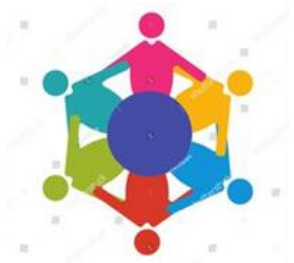
REUNIONES COMITÉ CONTROL SOCIAL